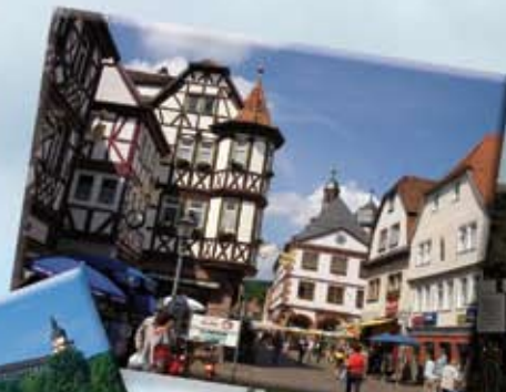
Lohr a. Main