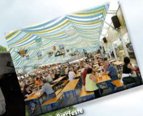
Wein- & Bierfeste