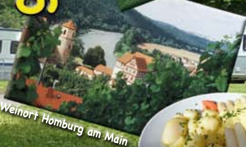
Weinort Homburg am Main