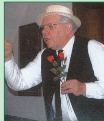
oder als Charmeur mit Herz und Rose