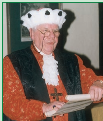
Kurfürst & Erzbischof von Mainz

Darbietung zugleich, die ich seit langem in meinem nicht eben weinar-men Dasein erlebt habe.