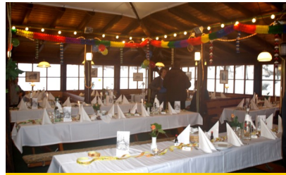
Betriebs- u. Familienfeiern