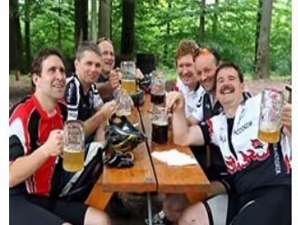
Eldorado für Biker