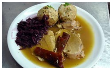
Braten- und Wildgerichte