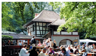
Biergarten mitten im Wald Sommer Di.-So. geöffnet !