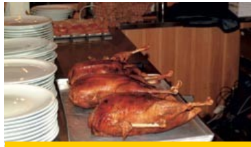
Ofenfrisches Gans-Essen von Oktober—Dezember