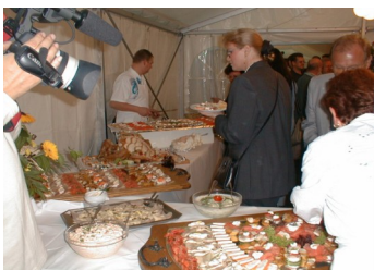
Festliche leckere Buffets