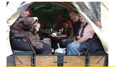
Kutschfahrten für Jedermann