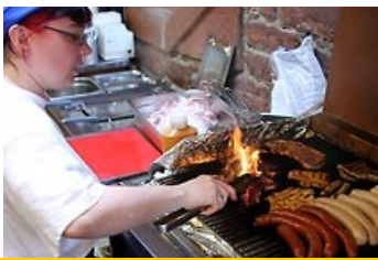
Weiß-/Wild- u. Bratwürste